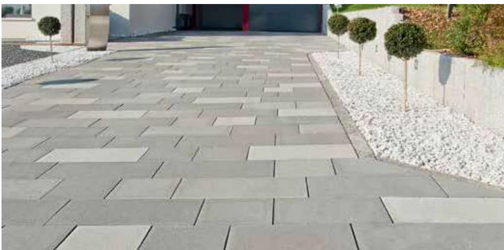
GDM.MOLINA stone kombiforma velká, žulově světlá/střední/tmavá, ferro soft