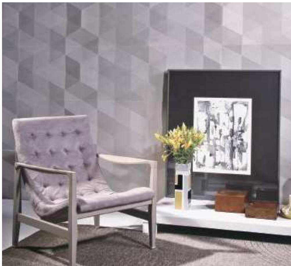
DYAMANTE visia bílá