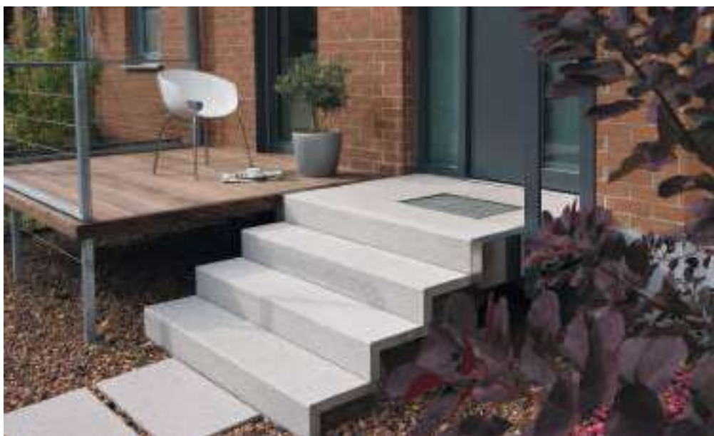
Schodišťový stupeň ruční výroba ferro šedá a podesta ruční výroba ferro šedá